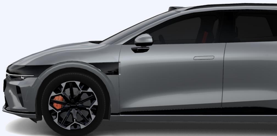
R20-дюймовые диски GT 255/40 R20 (Передние колеса оснащены немецкими четырёхпоршневыми суппортами оранжевого цвета Continental®)