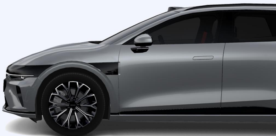
R19-дюймовые многоспицевые колеса 245/45 R19