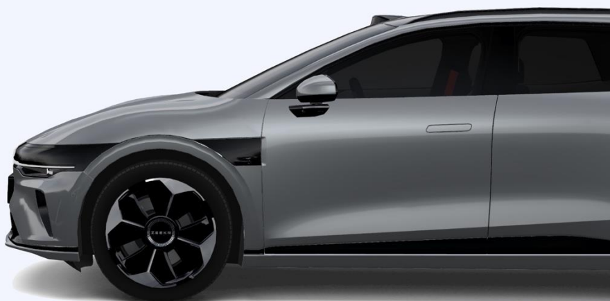
R19-дюймовые силовые диски 245/45 R19