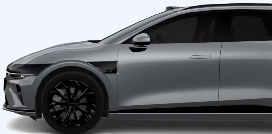
R19-дюймовая многоспицевая черная ступица 245/45 R19