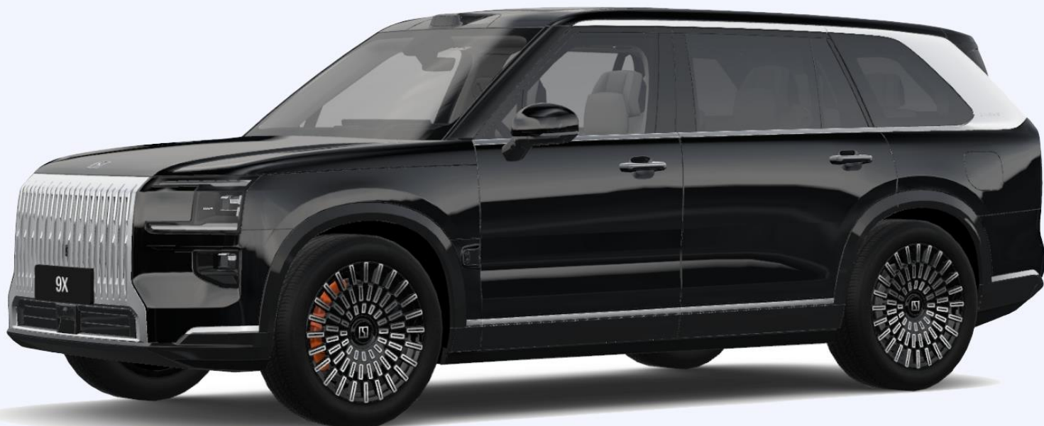
22-дюймовые кованные диски Xingyao с шестипоршневыми оранжевыми суппортами