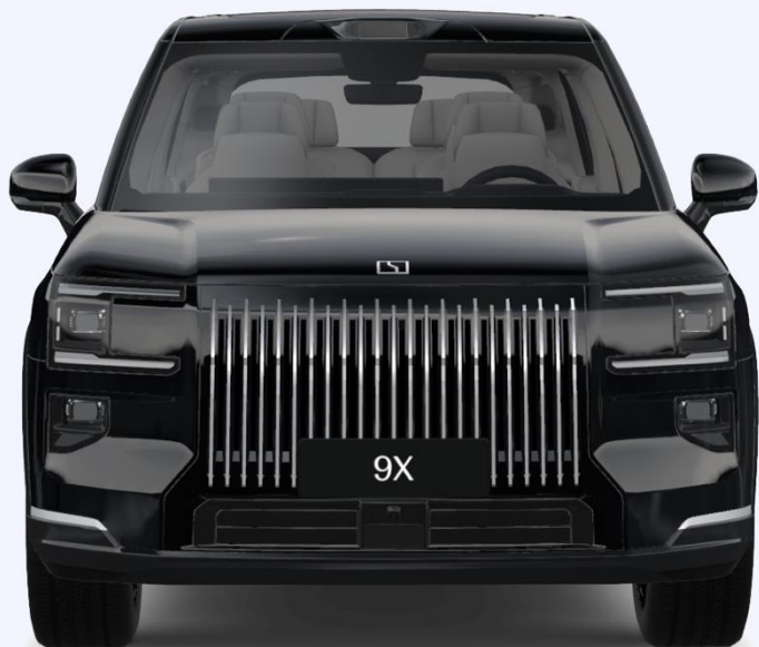
В цвет кузова