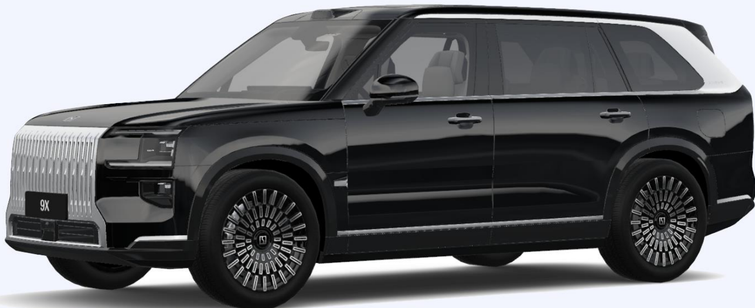
22-дюймовые кованные диски Xingyao с четырехпоршневыми суппортами